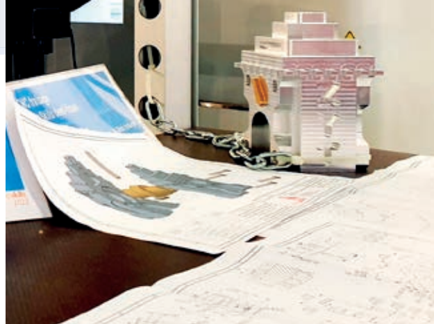
Die Prüfungsaufgabe im Final

Ja, sogar zwei (lacht). Zweimal ist das Fräswerkzeug abgebrochen. Nach dem ersten Mal wollte ich noch